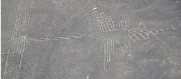
Peru 800 v.u.Z.

Metern lange „Scharrbilder“ in den Boden gekratzt. Und wenn man wollte, könnte man jetzt das Palm Island Resort in Dubai als modernste Form der Land-Art ansehen.